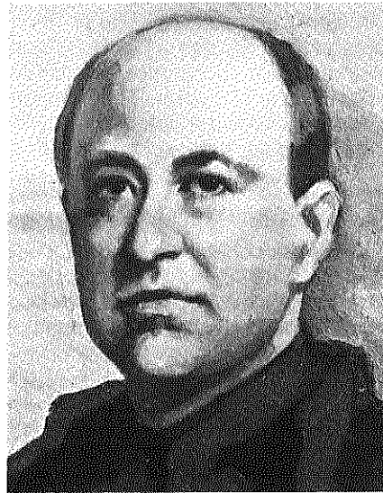
El Beat Enric d'Ossó i Cervelló fundador de les Teresianes