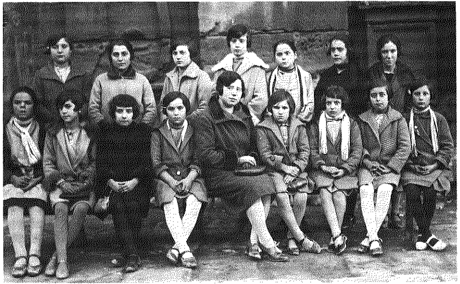
Una secció del «Rebañito del Niño Jesús» l'any 1925

Els diàlegs són d'una gran vivaça, la narració discorre fluida, amb molta correcció expressiva, riquesa de vocabulari i una lleugeresa rítmica que nega l'entrada a l'enfarfegament, la monotonia i la pesantor. La gràcia narrativa és present en qualsevol descripció física o psíquica dels personatges, gràcia que, a vegades, insinua una ironia respectuosa i fina,